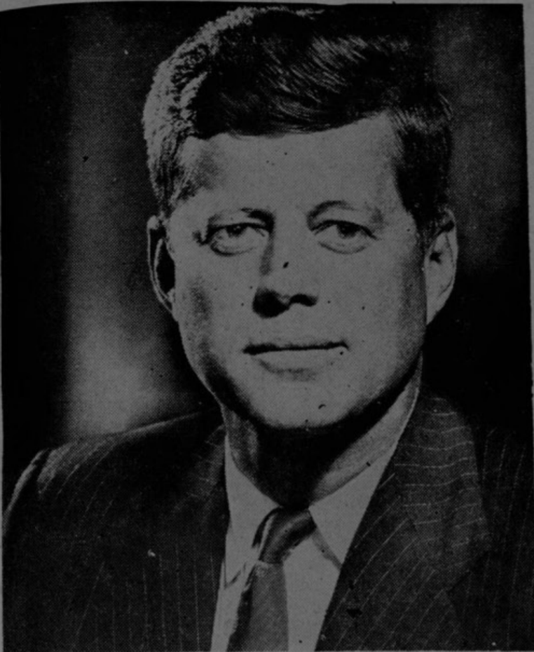
JOHN F. KENNEDY

Es cual gaviota que vive entre las flores chupando su miel cual los gorriones.